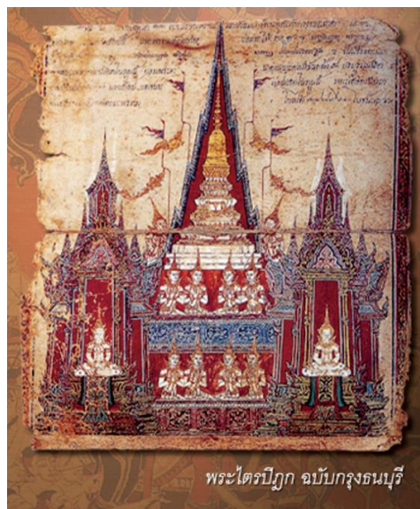
พระไตรปิฎก ฉบับกรุงธนบุรี

นอกจากนั้น ธิตาของพระเจ้านครศรีธรรมราช (หนู) คือ คุณฉิมและคุณปราง ยังได้รับราชการเป็นพระสนมในสมเด็จพระเจ้าตากสินมหาราช